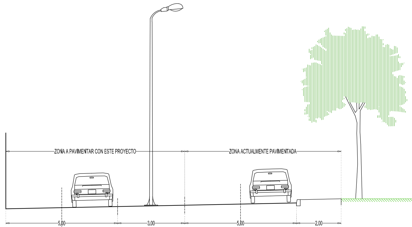
SECCIÓN TIPO (TRAMO B), escala 1:100